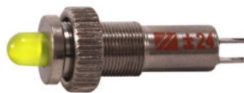
В металлическом корпусе