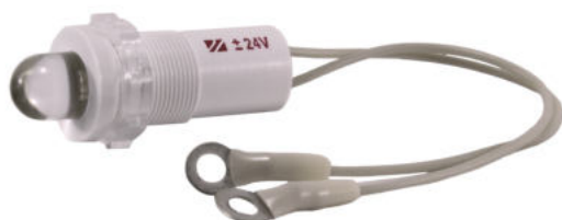
В пластмассовом корпусе