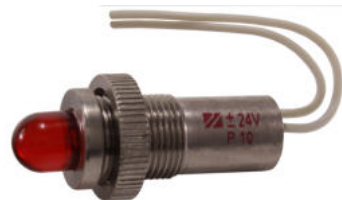
В металлическом корпусе