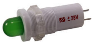
В пластмассовом корпусе